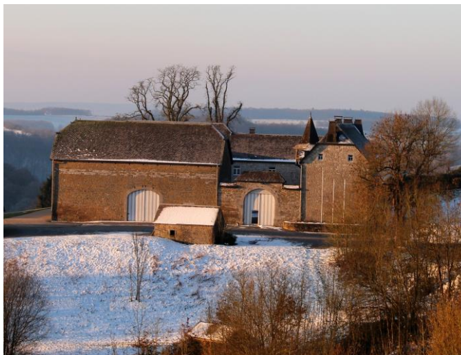
L'ancienne ferme du Grand Scley

Cette ferme a perdu sa vocation agricole en 1976. Les installations d'un vaste golf de 120 ha ( Five Nations Golf Club ) occupent aujourd'hui l'ancien domaine.