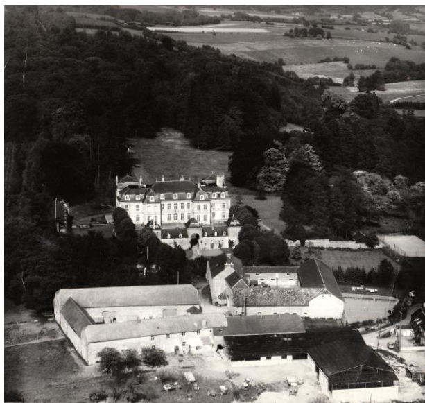
Le hameau de Bassines : le château et les deux fermes

Ce hameau est composé de quelques habitations, de deux fermes et d'un château qui fut presque totalement détruit en 1984.