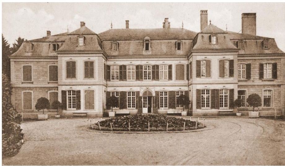
La cour intérieure du château de Bassines. Carte postale de 1919.

Sous l'Ancien Régime, ce hameau était une petite seigneurie foncière dénommée Biens de la Thour à Bassines attestée depuis le 14 e siècle. Les fermes céréalières exploitaient les terres fertiles entre ce lieu et Bois-et-Borsu au nord. Le domaine (130 à 150 ha) a appartenu successivement aux Sépulchrines de Huy, à l'abbaye de Saint-Hubert et à diverses illustres familles liégeoises. Par ventes, mariages et successions, il est passé entre les mains de plusieurs familles liégeoises dont les THONNAR, les de GRADY d'ORDENGE (ces derniers y font construire, en 1771, un manoir), les de GRUMSEL et enfin les van den STEEN de JEHAY qui ont agrandi le manoir au 19 e siècle pour en faire une vaste demeure castrale. Il n'en subsiste plus aujourd'hui que le bâtiment ouest, construit en avant du château et incluant le portail d'entrée.